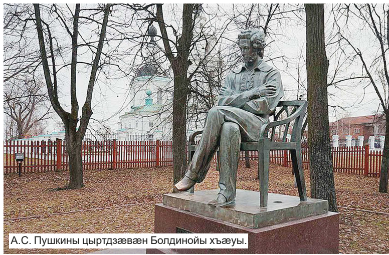
А.С. Пушкини цыртдзæвæн Болдиной хъæуы.

Денгизи атагъай – цъæх толдзæ; Уобæл – сузгъæрæй бид рæхис: Зелуй æд-æхсæвæг, æд-бонгæ Рæхисбæл ахурæнд тикис; Аргъау дзоруй, цæуæгæй галæумæ, Рахемæ – заруй гъур-гъурæй.